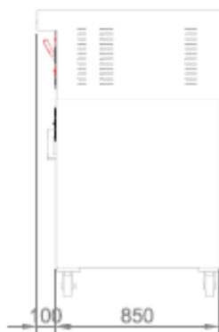
VISTA POSTERIORE + CELLA DI LIEVITAZIONE BACK VIEW + PROVER