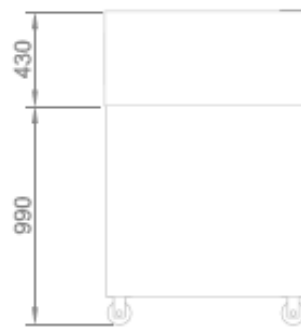
VISTA POSTERIORE + CELLA DI LIEVITAZIONE BACK VIEW + PROVER